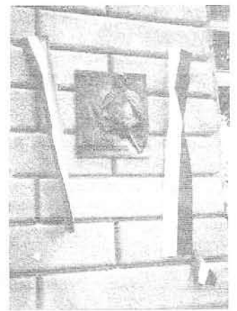
Zespół Misztral z Budapesztu. Tablica z podobizną B. Balassiego.