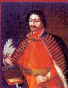
Bálint Balassi (1554–1594)

Mieszczanin krośnieński, Szkot z pochodzenia. Od 1632 r. faktor i serwitör królewski, komendant miasta w 1657 roku, był największym w tym czasie importerem win węgierskich na północ od Karpat. Jego działalność uczyniła Krosno w XVII w. jednym z najbardziej rozwiniętych miast regionu. Jest postacią bardzo zasłużoną, ma w mieście swoją uliczkę, a bicie słynnych dzwonów jego fundacji przypomina mieszkańcom grodu i okolicy o jego zasługach.