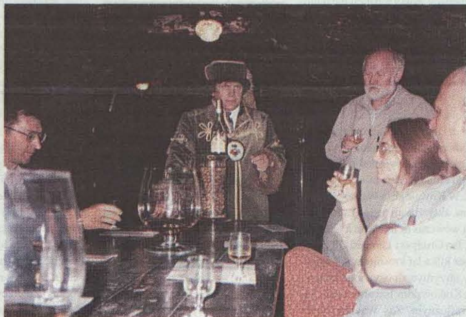
Krośnianie w węgierskiej winiarni