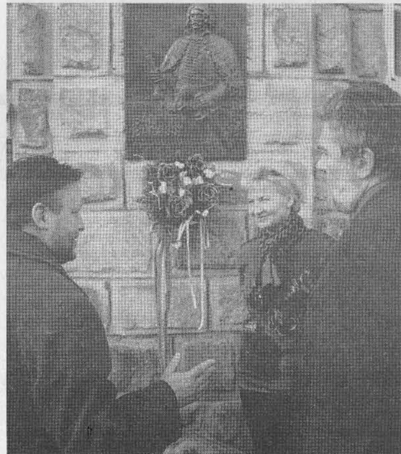
Przed tablicą Balinta Balassiego