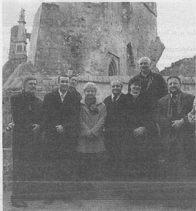
Delegacja węgierska na zamku Kamieniec